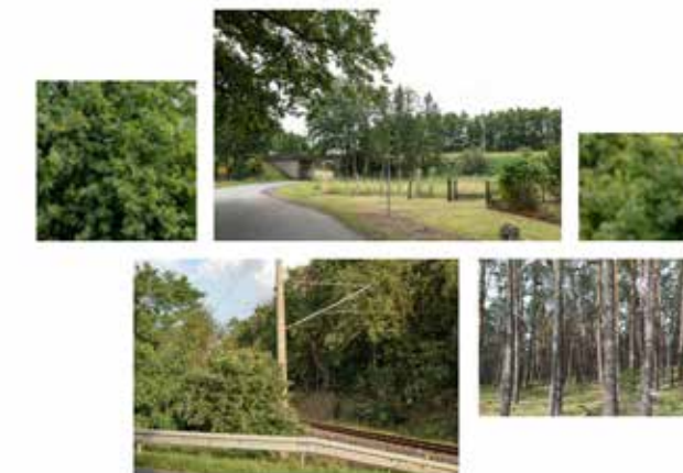
Farbschema: Vegetation Wald (VW-S1)