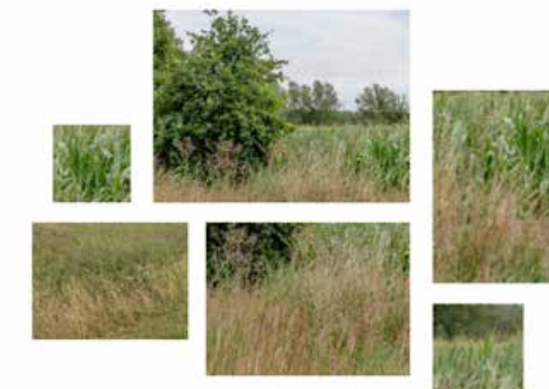
Farbschema: Vegetation Feld (VF-S1)